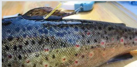
Ankkurimerkitty taimen

Merkin palauttaja saa aina palkkion ja osallistuu lisäarvontoihin. Merkinnöillä seurataan kalojen vaellusta ja kannan tilaa. Merkistä kirjoitetaan ylös koodi. Liitä koodin tiedot, kuten pyyntipaikka, paino ja pituus. Koodit voi lähettää maksutta osoitteeseen: LUKE, Merkit, 5005751, 00003 VASTAUSLÄHETYS tai sähköisesti https://lomakkeet.luke.fi/kalamerkki