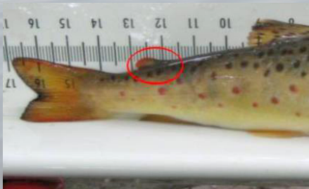
Rasvaevällinen taimen (luonnonkala)