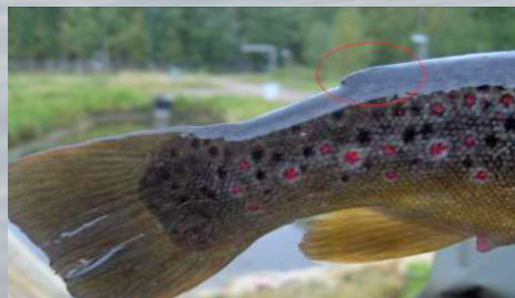
Eväleikattu taimen (istukas)

Vuoden 2016 alusta on rasvaevällinen taimen kalastusasetuksella rauhoitettu leveyspiiriin 64 eteläpuolella. Sääntö koskee siis myös Kymen ja Ruotsalaisen vesistöä.